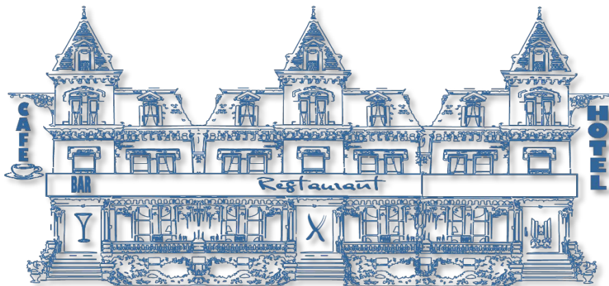
Abb 13|Hotel Sujet

Neben der Gehaltsstruktur eines Betriebs hat auch die gastronomische Variante des Betriebs direkten Einfluss auf das Organigramm.