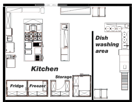
Abb 7|Einfache Küche

Der Ablauf ist klar und direkt. Ware reinbringen, vorbereiten, kochen, anrichten, raus damit. Spezialstationen gibt es selten, dafür viel Multitasking. Wer gerade grillt, kann im nächsten Moment schon die Desserts anrichten, denn der „Pâtissier“ ist oft dieselbe Person wie der „Souschef“, der „Gardemanger“ und der „Mitarbeiter des Monats“.